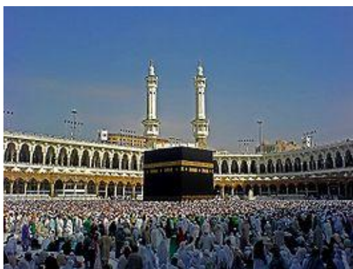
Hình 2. Đền thờ Kaaba của Hồi Giáo

- Tên Allah là tên thông dụng trong nền văn minh tiền - Hồi Giáo. Đó là nền văn minh thờ đa thần.