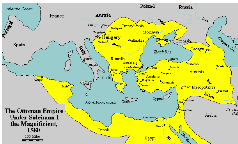
Hình 7.- Đế quốc Ottoman

Trong triều đại Sultan Suleiman the Magnificent (1520-1566), các tường thành của Cổ Đô Jerusalem được tái thiết. Dân số Do Thái tại Jerusalem từ từ gia tăng thêm nữa.