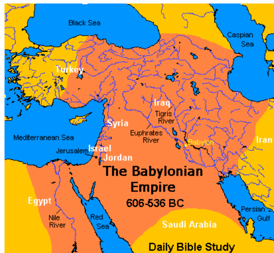
Hình 2.- Đế quốc Babylon

4- 587 BC: Vua Babylon là Nebuchadnezzar xua quân chiếm thành Jerusalem , phá đền thánh và đày dân Do Thái qua Babylon. Năm này là năm bắt đầu của một thời đại lâu dài của Do Thái dưới sự cai trị của các thế lực ngoại bang.