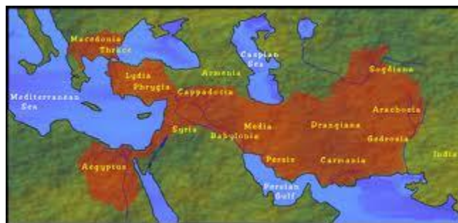
Hình 4.- Đế quốc Macedon trong triều đại Alexandre the Great

Vua Alexandre the Great xua quân chiếm Do Thái năm 333 BC. Vua để cho nước Do Thái tự trị, nhưng vào thời vua Antiochus IV, đền thánh bị vua làm ô uế (desecrated). Vì biến cố này, Maccabes (người Do Thái) khởi nghĩa (168 BC) thành công đem lại độc lập cho đất nước mình. Hiện bây giờ người Do Thái kỷ niệm cuộc khởi nghĩa này trong ngày lễ Hanukah.