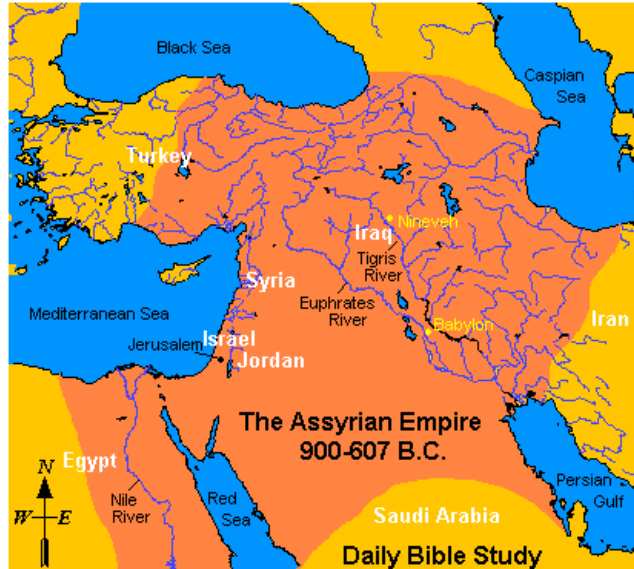
Hình 1.- Đế quốc Assari

Năm 626 BC, đế quốc Assari bị mất vào tay người Babylon.