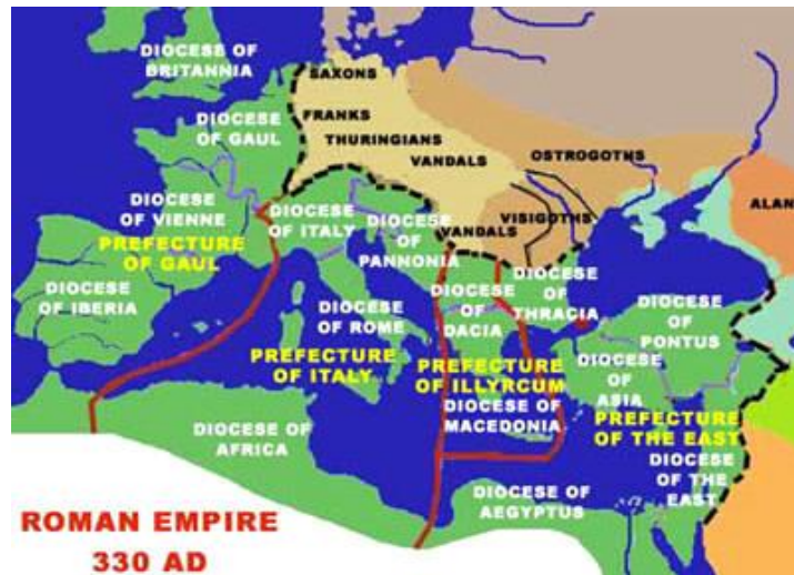
Hình 6.- Đế quốc Byzantine