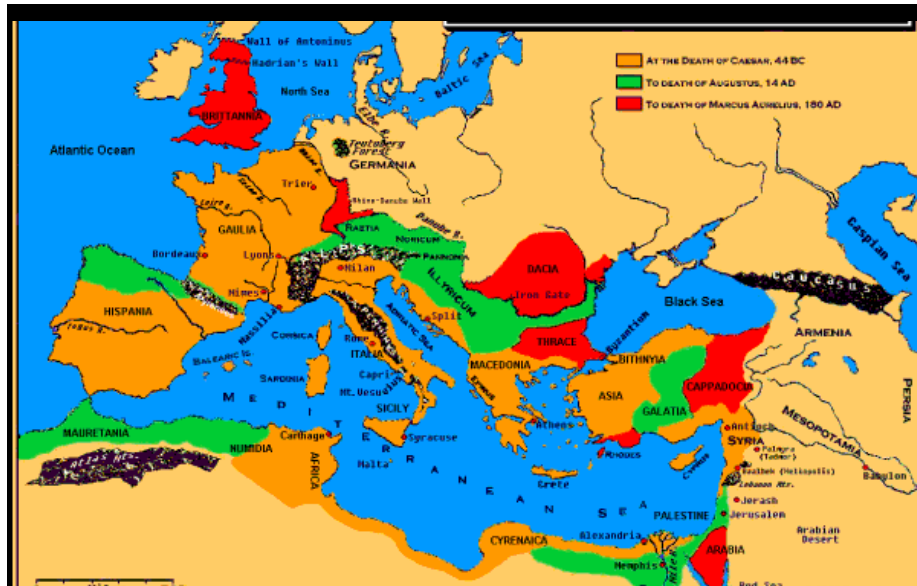
Hình 5.- Đế quốc Roma (La Mã)