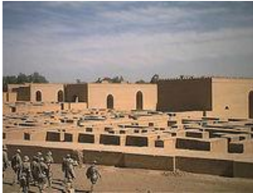
H1. Quân đội Hoa Kỳ trước Ba-by-lôn đang được tái thiết

Ba-by-lôn (Babylon) là một thành phố cổ tọa lạc trên bình nguyên phì nhiêu giữa hai con sông Hi-đê-ke (Tigris) và Ơ-phơ-rát (Euphrates) thường được gọi là vùng Lưỡng Hà (Mesopotamia = vùng đất giữa hai con sông), thuộc miền Nam Iraq ngày nay. Theo sử liệu thì Ba-by-lôn được xây dựng vào thế kỷ thứ 33 trước Công Nguyên (TCN), tức là cách nay khoảng 5300 năm. Danh xưng Ba-by-lôn trong tiếng Việt được phiên âm từ "Babylon" trong tiếng Hy-lạp (Greek). Ba-by-lôn trong nguyên ngữ tiếng Akkadian là "Babilu" và có nghĩa là "cổng Trời". Tiếng Akkadian là ngôn ngữ thông dụng của đế quốc A-si-ry (Assyria) và Ba-by-lôn thời cổ.