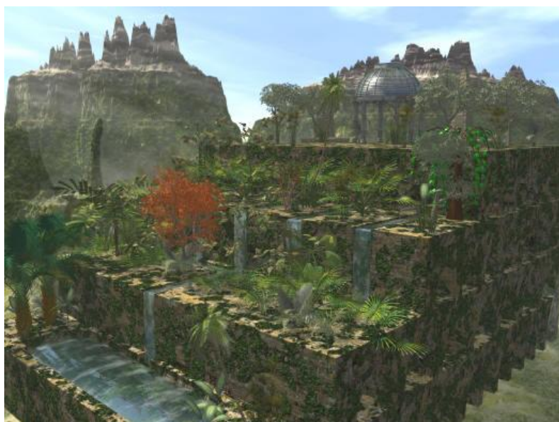
H2. Minh họa vườn treo của Ba-by-lôn cổ

Lần đầu tiên danh xưng Ba-by-lôn xuất hiện trong Thánh Kinh (Sáng Thế Ký 10:10) dưới dạng tiếng Hê-bơ-rơ (Hebrew) là Babel, có nghĩa là "cổng trời". Về sau, Chúa đổi lại là Ba-bel, có nghĩa là "lôn xôn." Căn cứ theo Thánh Kinh thì Ba-by-lôn là một trong những thành phố và cũng là vương quốc đầu tiên do loài người dựng nên. Thánh Kinh không nói gì nhiều đến Ba-by-lôn trong giai đoạn hình thành nhưng các tài liệu về lịch sử và tôn giáo thì đề cập đến một hệ thống chiêm tinh, bói toán, tôn giáo thờ lạy tà thần, thờ lạy chính Nim-rốt (Nimrod), vợ của Nim-rốt là Semiramis, và con của Semiramis là Tham-mu (Tammuz) [2], [4].