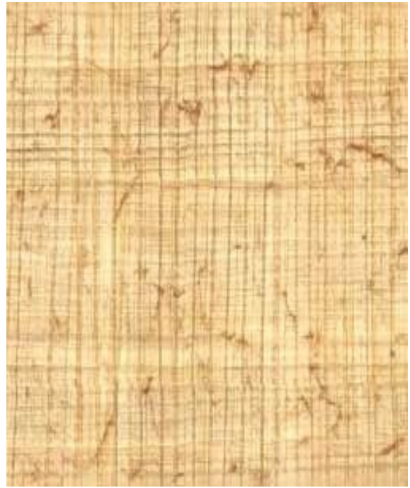
Giấy chỉ thảo

Tiếng Hê-bơ-rơ và tiếng Anh có một điểm tương đồng: chúng đều là "những ngôn ngữ tượng hình". Các từ liệu của chúng hình thành một hình ảnh rõ ràng trong trí của bạn. Như William Tyndale, người đầu tiên in Thánh Kinh Anh ngữ, một lần nhận định rằng, việc phiên dịch từ tiếng Hê-bơ-rơ, so với các ngôn ngữ khác, sang tiếng Anh thì dễ hơn đến mười lần. Tyndale dĩ nhiên là người có đủ tư cách để đưa ra lời nhận định trên bởi vì ông là người thông thạo đến tám ngôn ngữ, thông thạo một ngôn ngữ ở đây có nghĩa là bạn có thể công nhận ông sử dụng ngôn ngữ nào cũng như là tiếng mẹ đẻ của ông.