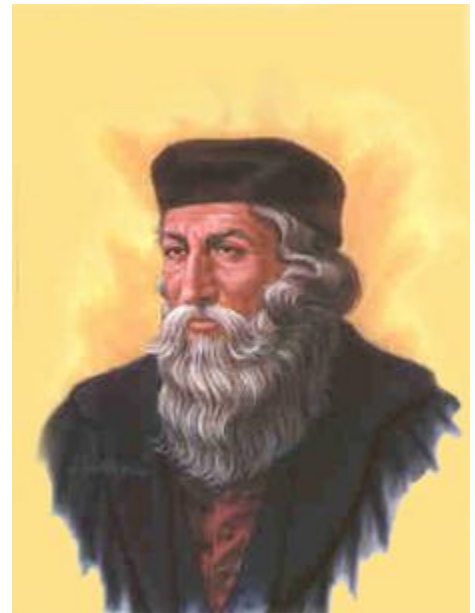
Hình vẽ John Wycliffe

http://www.greatsite.com/timeline-english-bible-history/pre-reformation.html