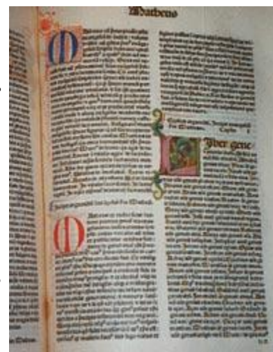
Ấn bản Latin Vulgate 1480

Vào năm 500, Thánh Kinh đã được phiên dịch sang hơn 500 ngôn ngữ. Chỉ một thế kỷ sau đó, năm 600, nó bị giới hạn trong chỉ một ngôn ngữ: bản dịch Latin Vulgate. Tổ chức giáo hội duy nhất, được công nhận vào thời điểm đó là Công Giáo của La-mã, và họ đã từ chối việc cho phép Thánh Kinh được dịch ra bất cứ ngôn ngữ nào ngoài tiếng Latin. Người nào sở hữu bản dịch Thánh Kinh khác Latin sẽ bị hành quyết! Lý do là, chỉ có các thầy lễ (priests) được dạy cho biết tiếng Latin, và điều này đem lại cho giáo hội quyền lực tối cao... là quyền thống trị mà không bị chất vấn... là quyền lừa dối... là quyền tống tiền quần chúng. Không ai có thể thắc mắc về những lời giảng "Thánh Kinh" được, bởi vì chỉ có một số ít người, ngoài những thầy lễ, có thể đọc tiếng Latin. Giáo hội đã làm giàu trên sự ngu dốt áp đặt này trong suốt 1000 năm. Thời kỳ từ năm 400 đến 1400 được biết đến với cái tên "Thời Trung Cổ Đen Tối".