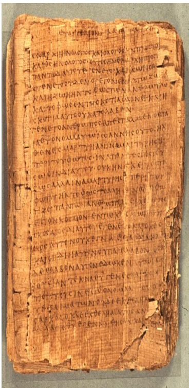
Văn tự viết trên chỉ thảo

Tiếng Hê-bơ-rơ và tiếng Anh có một điểm tương đồng: chúng đều là "những ngôn ngữ tượng hình". Các từ liệu của chúng hình thành một hình ảnh rõ ràng trong trí của bạn. Như William Tyndale, người đầu tiên in Thánh Kinh Anh ngữ, một lần nhận định rằng, việc phiên dịch từ tiếng Hê-bơ-rơ, so với các ngôn ngữ khác, sang tiếng Anh thì dễ hơn đến mười lần. Tyndale dĩ nhiên là người có đủ tư cách để đưa ra lời nhận định trên bởi vì ông là người thông thạo đến tám ngôn ngữ, thông thạo một ngôn ngữ ở đây có nghĩa là bạn có thể công nhận ông sử dụng ngôn ngữ nào cũng như là tiếng mẹ đẻ của ông.